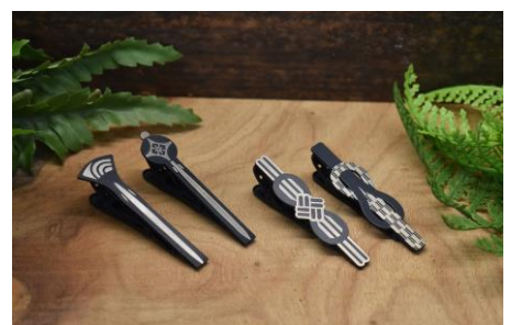
ブランド名を「かざはな」と命名