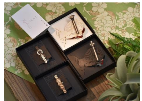
島田市の鬮祭り・帯祭りをイメージしたネクタイピン