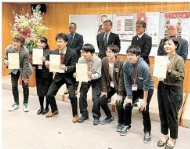
最終審査会の表彰式で記念撮影に臨む受賞者ら =16日午後、静岡市葵区