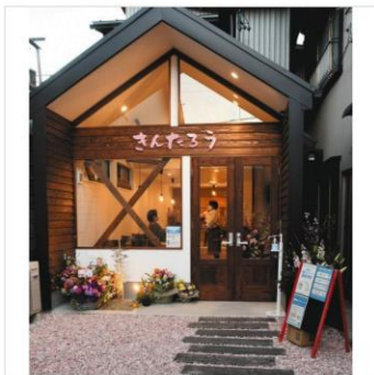
カフェに改装した「きんたろう」＝湖西市新居町のきんたろうで