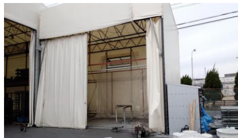
前処理装置(表面処理装置)全景

有害物質を使用しないことは、特に安全性を重視する農業機械分野や食品製造機械分野のニーズが大きいと推察される。また従業員や環境に優しいものであり、植物性溶液(ポリフェノール溶液)を使用した前処理を実用化する効果は大きいことが期待されることから、新たな前処理設備を構築した。