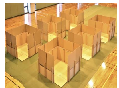
災害時には6~8ブースの間仕切りへ寄りかかることができる！

避難所用間仕切りとして、イベントを通じ小学生にも組み立ててもらえることが証明でき、行政の危機管理担当者にも利用できるとの評価を得た。また、学校関係者からは、実際の避難所になった時にプライベートを守るスペースとして実感してもらえるところが良いと評価してもらえたことから、今後も引き続き多くの子供に触れてもらう、見てもらう機会を作っていく。そのほか、避難所運営は多くの関係者がそれぞれの立場で機能することが求められることから、商品を通じ関係者が議論できる場を提供していく。