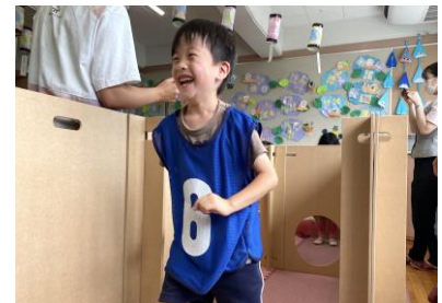
普段は迷路など自由に組みかえて、いろいろな用途で利用して、楽しむ！

間仕切りが備蓄されることで、速やかに快適なスペースが確保され、住民の心の安心につながる。企業からの寄贈という形で納入施設が増えており、遊具として子供たちが普段から利用することを通じて、防災意識の啓発や災害時の間仕切りの円滑な活用を促した。また、企業の地域貢献活動として、ただ納入するのではなく、イベントを実施して使い方・防災に関する知識など、知る機会を作って協力企業と連携して普及を進めた。