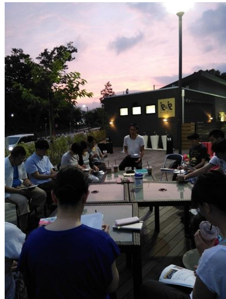
← ↑ 先輩起業家訪問