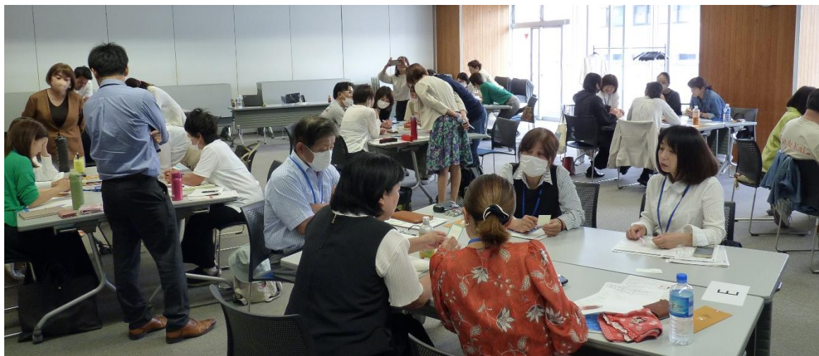
↑ 起業スタートアップ塾