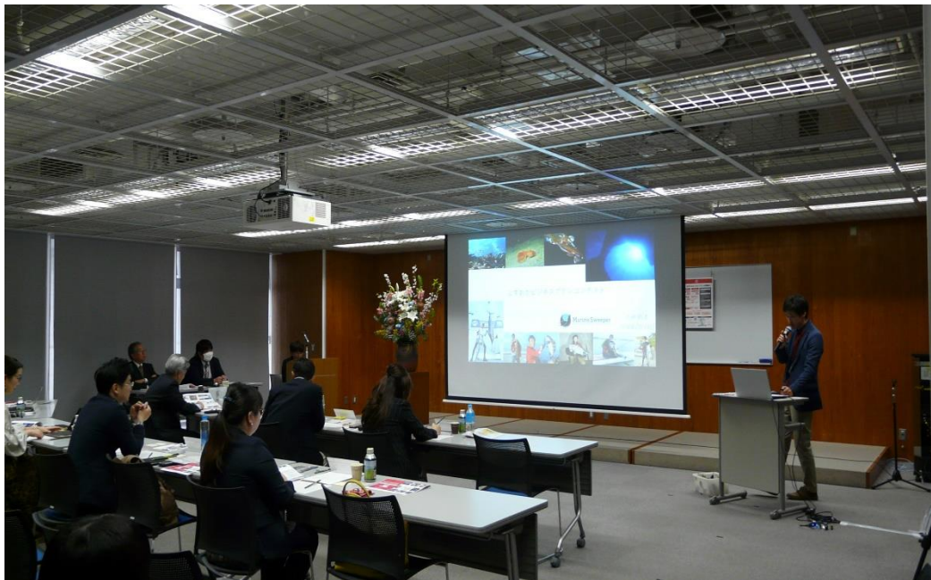
↑ ビジネスプランコンテストの開催