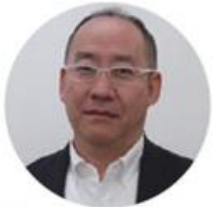
あさはら のぶゆき 朝原 伸之