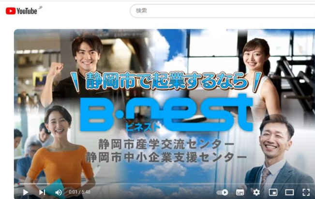
静岡市での起業に関する無料相談はB-nestへ!! ~概要と利用方法 編~ (静岡市産学交流センター・静岡市中小企業支援センター)