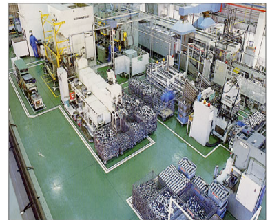
本社（岡部）工場内部