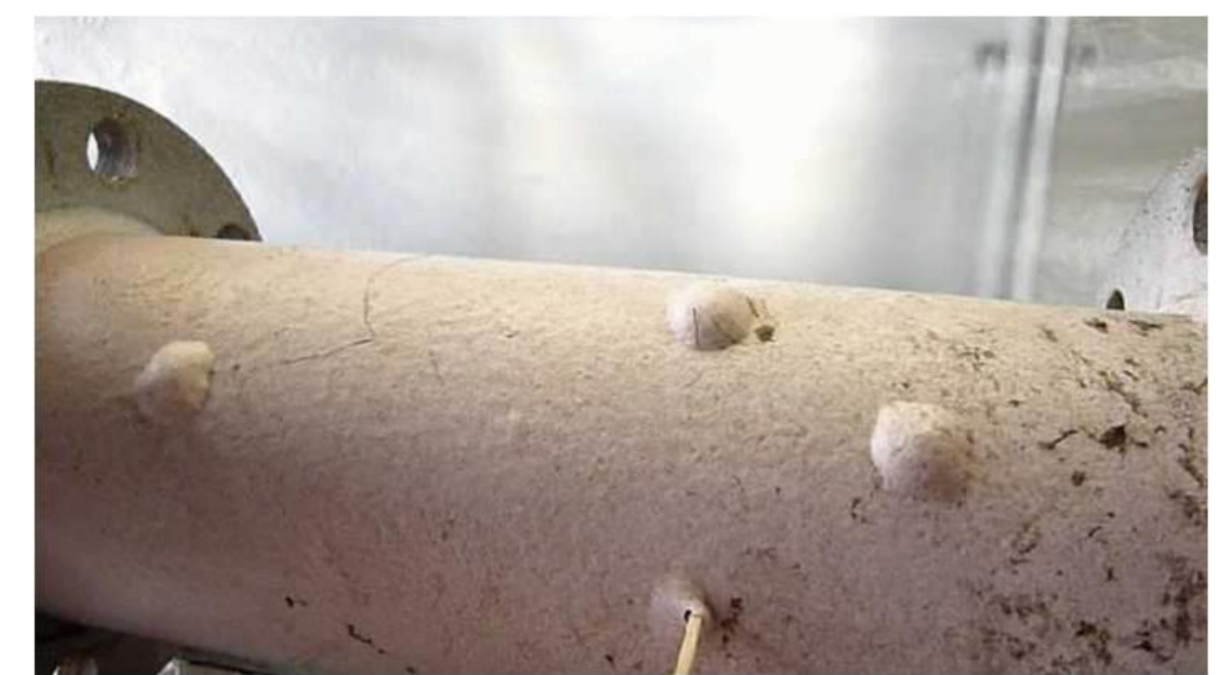
図-4 加圧状態からの空気漏れ