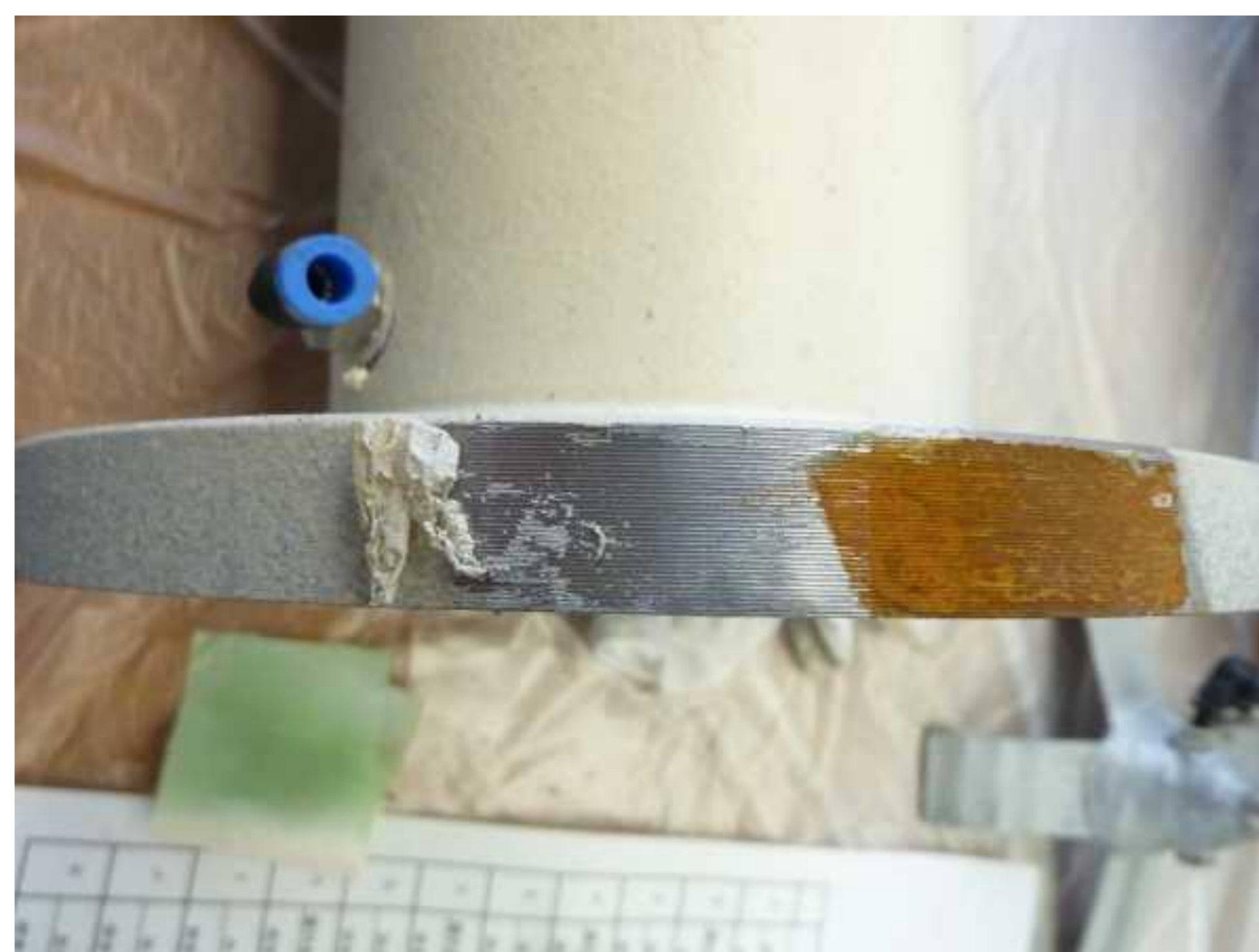
図-3 シリコンゴムコーティングを剥がした状態