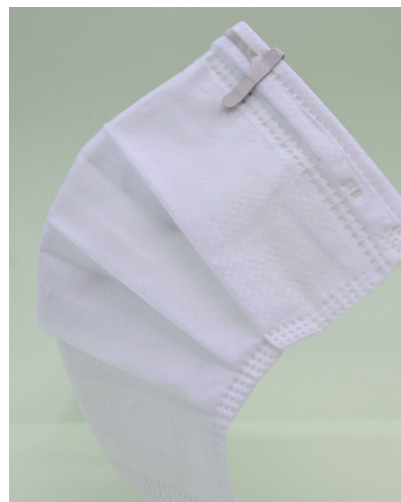
装着後のマスク側面 3Dメタルフレームが、マスク内部を前に広げて、口とマスクの間の空間を確保、呼吸や会話が快適に