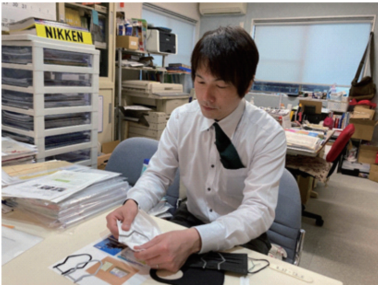
岩本代表取締役との打ち合わせの様子