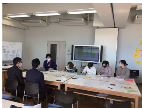
産学連携ミーティング（3回目）の様子