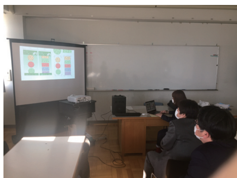
シールデザイン 中間プレゼンテーション