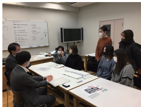
産学連携ミーティング（2回目）の様子