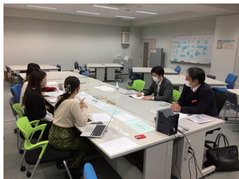
常葉大学造形学部学生との顔合わせ