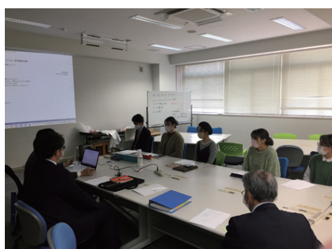
シールデザイン 最終プレゼンテーション