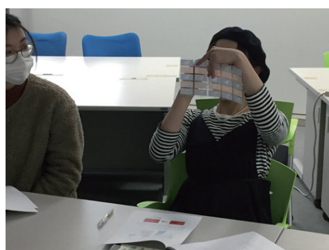
最終デザイン決定に向け、ディスカッション。 学生がデザインしたシールが、実際に小売店店頭にて販売されることを目指し、取り組んでいます。