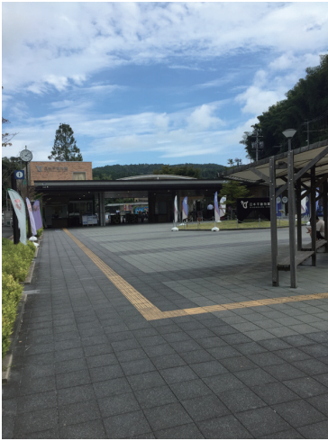
静岡市立日本平動物園エントランス