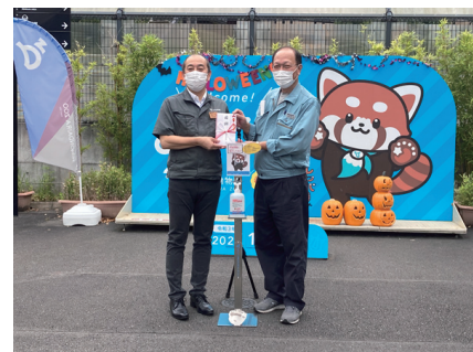
令和3年10月12日 静岡市立日本平動物園での「贈呈式」

同事業を通じて静岡市立日本平動物園と連携した製品。ペダルにホッキョクグマ「ロッキー」の足形をデザイン。