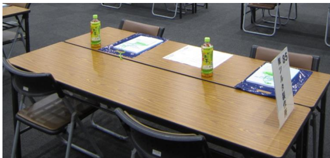
※商談ブースのイメージ図

座席の数に限りがございますので、当日の商談ブースの受注企業の側の席は 2名まで となります。商談する会社によって担当の方を変えていただくことは可能ですが、一度に多人数が押し掛けると、会場内が過剰に混雑する原因となってしまうので、ご配慮とご協力をお願いいたします。