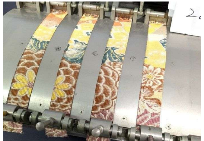
摩擦試験機II形（学振形）による評価