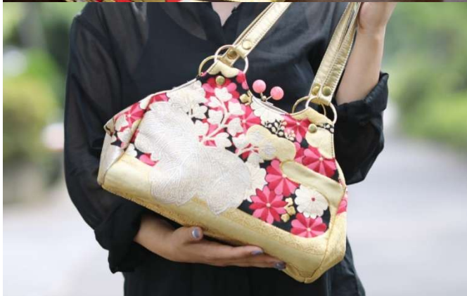
材料生地（上）とリメイク後のバッグ（下）