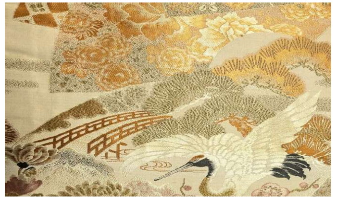
耐久性向上試験に使用した帯生地