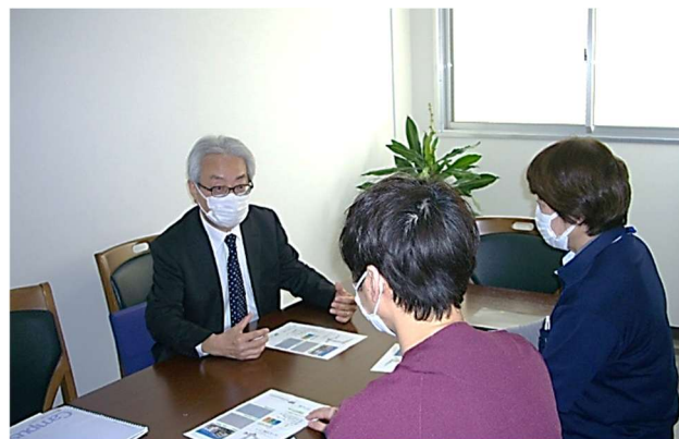
モニタリング後の意見交換