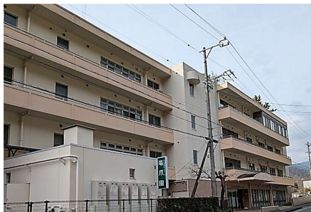
特別養護老人ホーム「竜爪園」（静岡市葵区）