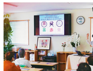
「認知症予防サービス事業化」 ヘルスケアビジネス事業化促進助成事業