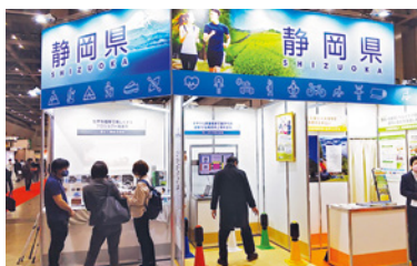
「健康博覧会（静岡県ブース）」 展示会への出展支援

身体的・精神的・社会的に満たされ、より豊かで充実した人生を送ることができるように、健康寿命の延伸などにつながるウェルネスサービスや製品の事業化を支援しています。