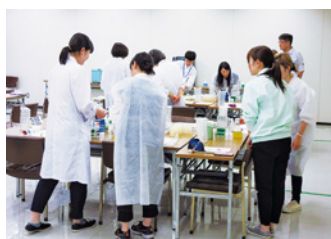
総合食品学講座 実習

高付加価値化と食の社会課題解決の両立を目指すため、フードテックを活用した未来型食品の開発、企業の販路開拓、産業を担う人材育成などを行っています。