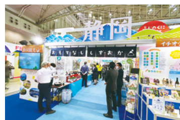
「スーパーマーケットトレードショー静岡県ブース」 展示会への出展支援